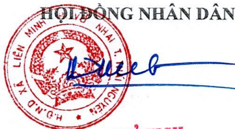
CHỦ TỊCH Vương Việt Dũng